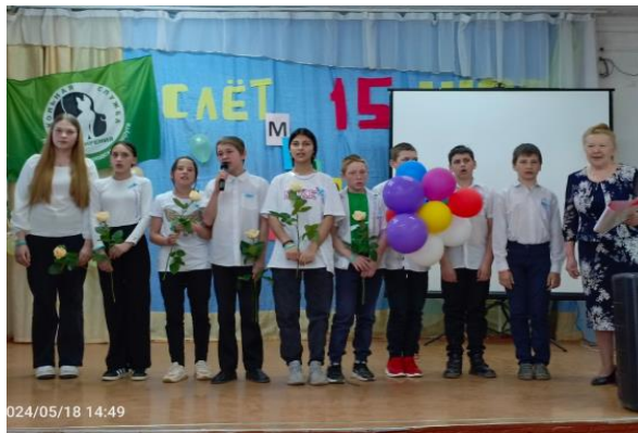
Слет «15 мгновений весны» Нытвенский округ