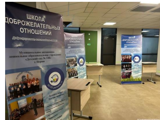
«Школа доброжелательных отношений» г. Пермь