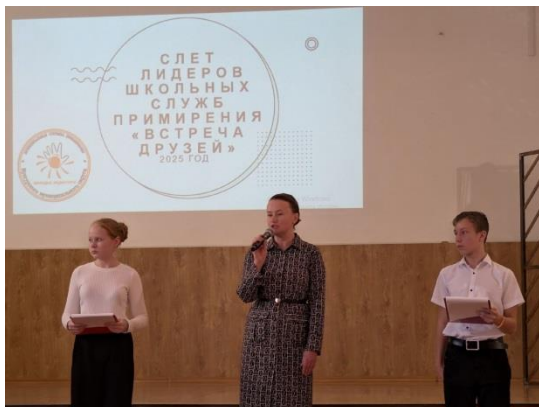
Муниципальный слет лидеров ШСП Кунгурский округ